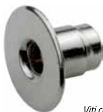
Viti con rondella assemblata