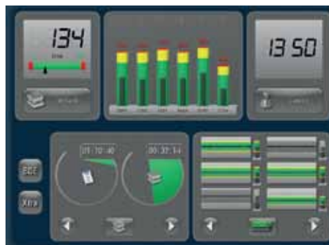
A sinistra: report della produzione. Stop & Go registra automaticamente il funzionamento e i tempi passivi della macchina fino a 90 giorni A destra: cruscotto di controllo. Visualizza una serie di parametri: contatori, forze massime, tendenza/ sicurezza utensili e curva involuppo

affidiamo al Reparto Qualità anche le verifiche dei pezzi di ritorno dai nostri terzisti certificati, procedendo poi alla raccolta di tutte le informazioni provenienti dai vari siti periferici da elaborare con un sistema gestionale, indispensabile per creare i certificati finali».