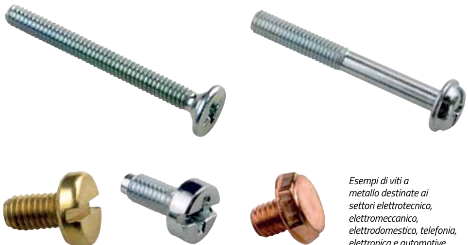
Esempi di viti a metallo destinate ai settori elettrotecnico, elettromeccanico, elettrodomestico, telefonia, elettronica e automotive

Tutti ne parlano, molti si stanno informando sulle possibili future applicazioni nel proprio ambito produttivo ma pochi, a oggi, applicano realmente i dettami dell' Industry 4.0 all'interno dei processi aziendali, con tutte le potenzialità intrinseche che questo nuovo modo di operare, definito come la quarta rivoluzione industriale, è in grado di offrire a chi sa cogliere questa grande opportunità. Opportunità che una società come Mevi Italia Srl ha saputo sfruttare al meglio, passando da una gestione aziendale classica a una digitalizzazione dei processi, abbandonando i supporti cartacei a favore di un'integrazione completa tra le varie funzioni di stabilimento attraverso l'utilizzo del controller Brankamp X7 di Marposs, capace di interfacciarsi perfettamente con il software dedicato Easyprod 4.0 di Fastdev. Un piano strategico molto importante, quello adottato dalla società di Cassolnovo (PV), nata nel 1984 e divenuta oggi uno tra i maggiori produttori europei di minuterie stampate a freddo, vantando un'esperienza di oltre trent'anni nella lavorazione dei metalli, che le ha permesso di puntare all'ampliamento e al rinnovamento degli impianti investendo in tecnologia di ultima generazione. Specializzata nella produzione di viti di metallo, da M1,2 a M8 in conformità alle norme nazionali e internazionali, con teste a intaglio cacciavite di tipo a croce, esalobato, esagonale, antieffrazione, con rondella, autofiletanti e rivetti, la società pavese ha messo