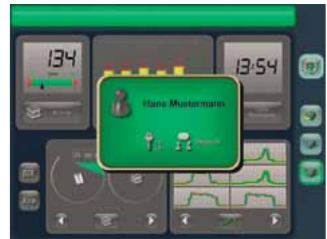
Una serie di videate del Brankamp serie X7 di Marposs

utilizzando impianti di ultima generazione, di fare parlare direttamente il prodotto dell'azienda bolognese con il gestionale di Fastdev, migliorando tutta quella parte di comunicazione che mancava nel nostro precedente sistema e governando totalmente la produzione, con anche l'obiettivo di semplificare l'approccio da parte dell'o-