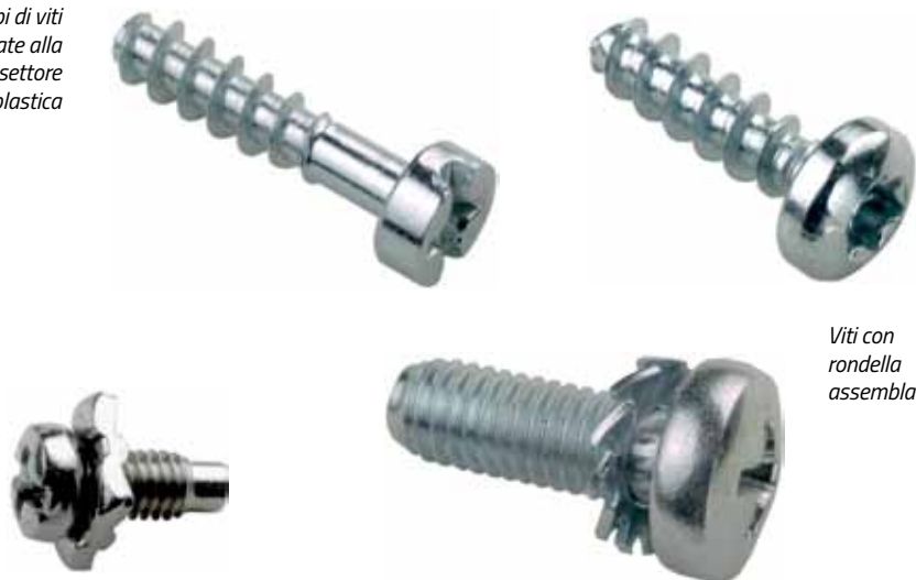
Viti con rondella assemblata

tutte le operazioni di formatura, mentre il reparto di fresatura è dotato di una decina di macchine utensili destinate alla creazione del taglio da cacciavite sulla testa delle viti, operazione quest'ultima piuttosto delicata e complicata proprio in considerazione delle dimensioni molto ridotte del prodotto. Completa il ciclo produttivo il reparto di rullatura, nel quale sono installate macchine a pettini piani e a rullo, queste ultime capaci di una cadenza operativa di 1200 pezzi al minuto.